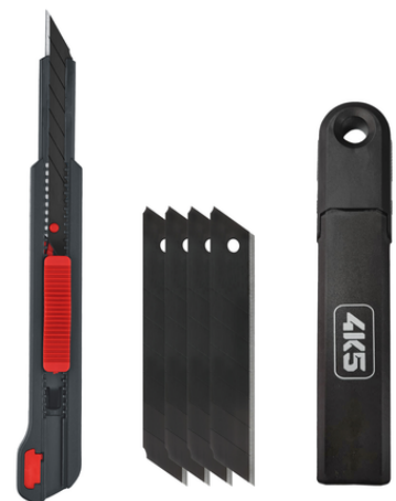
CR 9 S, 5 Klingen