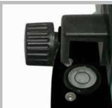
Miroir pour un alignement simple