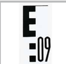
Vue de l'échelle avec division en E