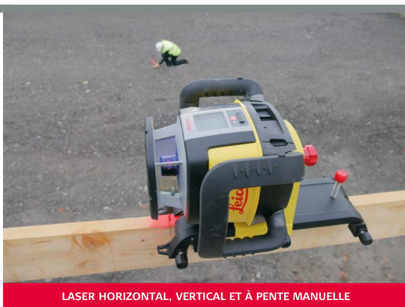
LASER HORIZONTAL, VERTICAL ET À PENTE MANUELLE