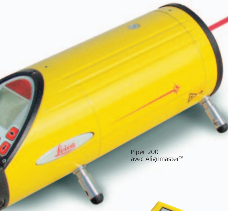
Piper 200 avec Alignmaster™