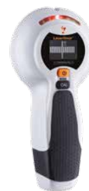
CombiFinder Plus + pile

Dimensions de l'emballage (L x H x P) 313 x 123 x 60 mm