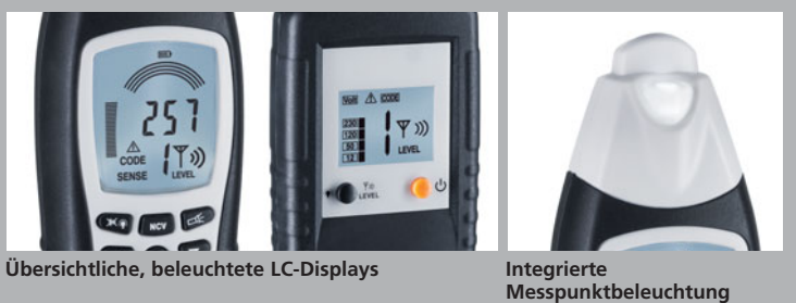
Übersichtliche, beleuchtete LC-Displays

Verpackungsgröße (B x H x T) 440 x 370 x 110 mm