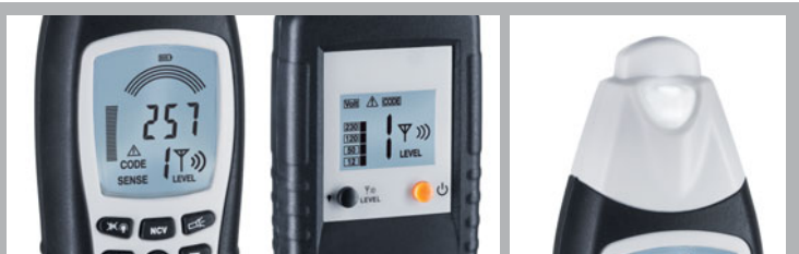
Écrans d'affichage clairs et éclairés

Dimensions de l'emballage (L X H X P) 440 x 370 x 110 mm