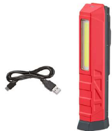
FL 500, USB-C-Kabel