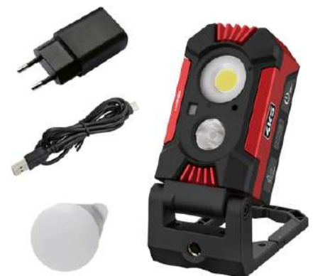
HD 1500, Diffusor, Netzteil, USB-C-Kabel