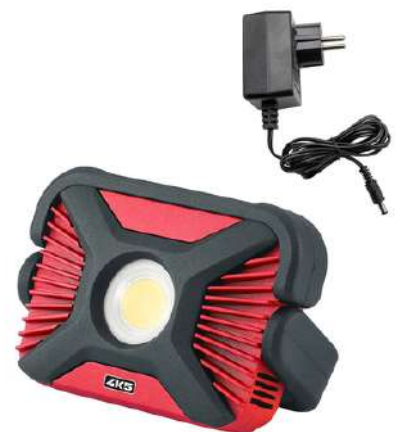
HD 2000, Netzteil