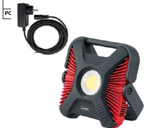
HD 6000, Netzteil