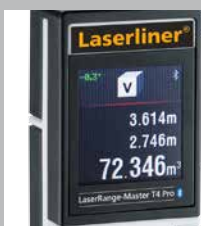
Afficheur couleur à cristaux liquides rétroéclairé

Dimensions de l'emballage (L x H x P) 113 x 236 x 64 mm