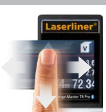
Écran tactile pour le commutateur de fonction