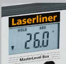
Écran d'affichage éclairé