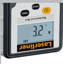
Écran d'affichage pivotant