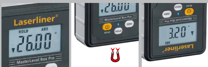
Écran d'affichage éclairé magnétique