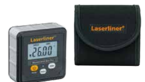
Écran d'affichage pivotant

MasterLevel Box Pro inclus sacoché + pile (1 x 1,5 V du type AAA) Dimensions de l'emballage (L x H x P) 90 x 230 x 55 mm