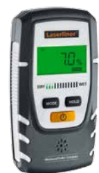
MoistureFinder Compact + Batterie