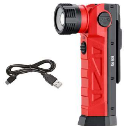
RA 500, USB-C-Kabel