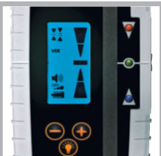
Beleuchtetes LC-Display, superhelle Signal-LED's