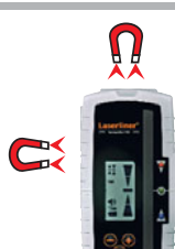
Kopf- und Seitenmagnete