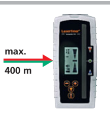
Für rote und grüne Laser max. 400 m