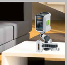
FlexClamp Plus sur pied