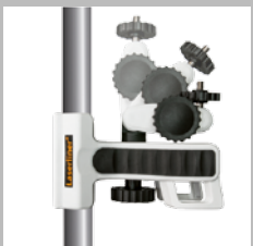
Réglage aisé et possibilités de fixation variées