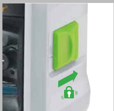
Blocage du système pendulaire pour un transport en toute sécurité