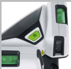
Libellen zur Justierung des Gerätes