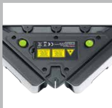
Anlegerkanten und Auflagefläche