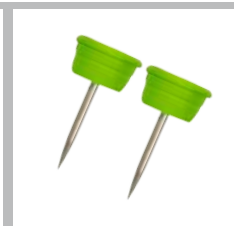
Inclus broches spéciales