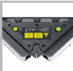
Bord de guidage et surface de pose