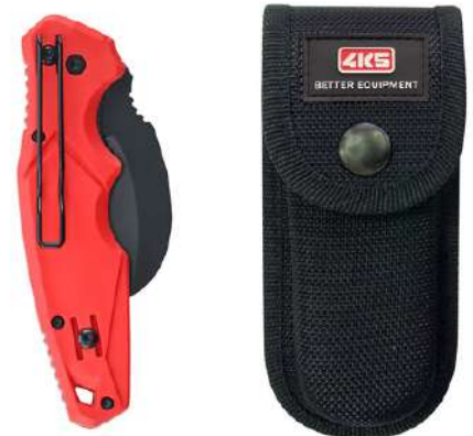
TK 101, Holster