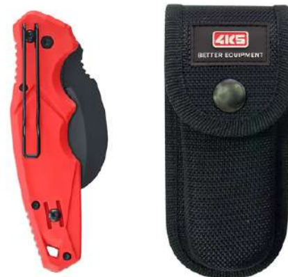
TK 101, Holster