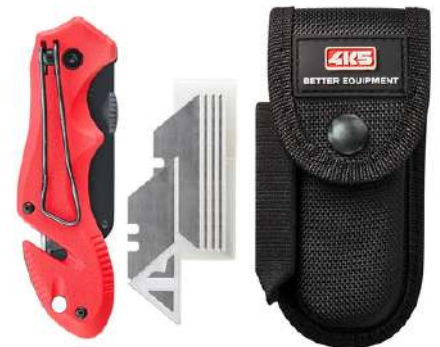
TK 300, 6 Klingen , Holster