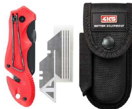
TK 300, 6 Klingen , Holster