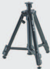
Leica TRI 70 ● ●

Le petit trépied portable pour l'usage quotidien avec réglage fin simple. Doté d'une nivelle. Extensible de 0,40 m à 1,15 m. Réf. 794 963