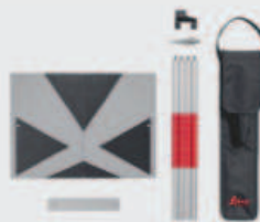
Kit Leica TPD 100 ●

La plaque de mire pour de meilleures visées avec la caméra numérique sur de longues distances. Le kit comprenant une canne et une nivelle permet de mesurer sur des points de repère et d'effectuer des levés de base avec un Leica DISTO™. Réf. 6012352