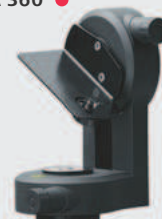
Adaptateur Leica FTA 360 ●

Adaptateur stable à réglage fin pour une visée confortable et exacte. Il facilite la visée surtout sur de longues distances et minimise les écarts de mesures indirectes. Se combine avec les trépieds Leica TRI 70, TRI 100, TRI 120 et TRI 200. Réf. 828414 pour Leica DISTO™ S910. Réf. 799301 pour Leica DISTO™ D510 et D810 touch