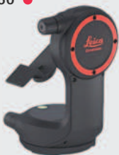
Encodeur Leica DST 360 ●

L'encodeur transforme les Leica DISTO™ X3 et X4 en station DISTO™. Il permet des mesures P2P avec l'appareil et devient même un outil de planification complet avec l'application Leica DISTO™ Plan. Réf. 848783