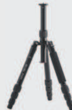
Leica TRI 120 ●

Les leviers de verrouillage pour les pieds rendent ce trépied encore plus stable. Les pieds pliables sur 180° garantissent une grande compacité. Idéal pour tout adaptateur de trépied pour tous les modèles Leica DISTO™. Réf. 848 788