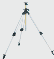
Leica CET 103 ●

Trépied aluminium multifonctionnel, élévateur avec vis de fixation 5/8", bretelle, éléments de blocage rapides et nivelle, hauteur de travail 0,84 m – 2,46 m, avec échelle mm, pieds en caoutchouc remplaçables. Réf. 768 033