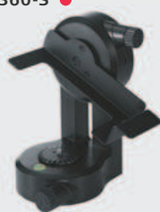
Adaptateur Leica FTA 360-S ●

Adaptateur stable à réglage fin pour une visée confortable et exacte. Il facilite la visée surtout sur de longues distances et minimise les écarts de mesures indirectes. Se combine avec les trépieds Leica TRI 70, TRI 100, TRI 120 et TRI 200. Réf. 828414 pour Leica DISTO™ S910. Réf. 799301 pour Leica DISTO™ D510 et D810 touch