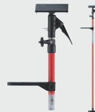
Tige de calage Leica CLR 290 ●

Avec plateforme de fixation universelle pour lasers à ligne et rotatifs. Extensible jusqu'à 2,90 m. La tige peut être fixée entre le sol et le plafond. Cela permet un positionnement continu des lasers à différentes hauteurs. Réf. 761 762