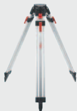
Leica TRI 200 ●

Trépied en aluminium léger et très stable, avec une vis de fixation 3/4", une nivelle et un verrouillage par serrage permettant une installation simple. Longueur d'extension de 0,75 m à 1,15 m. Idéal avec Leica FTA 360 ou FTA 360-S. Réf. 828 426