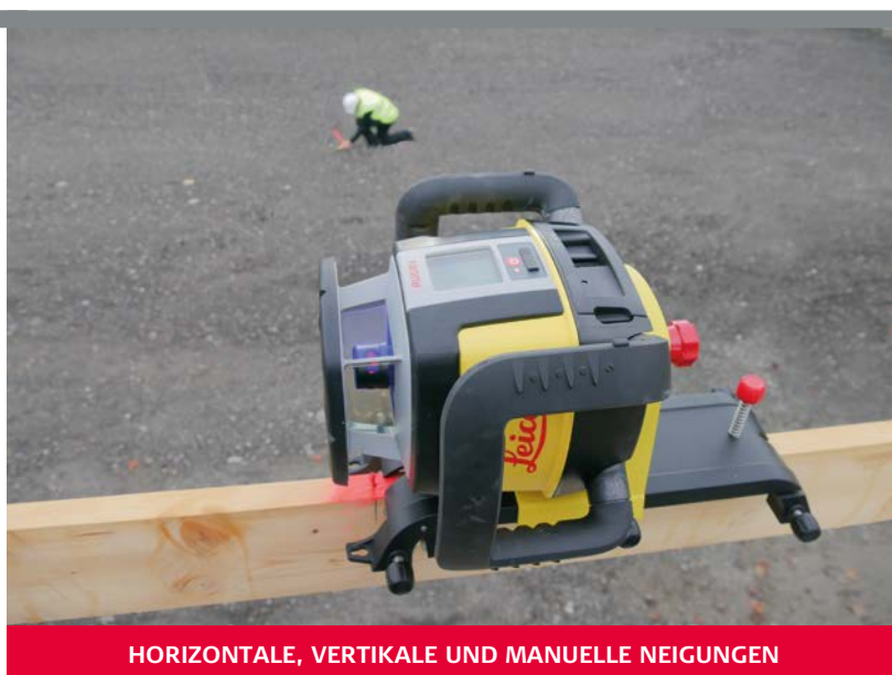
HORIZONTALE, VERTIKALE UND MANUELLE NEIGUNGEN