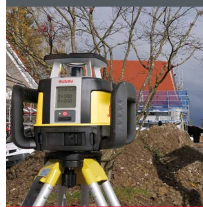
HORIZONTALER, VERTIKALER UND NEIGUNGSLASER MIT DIREKTEINGABE