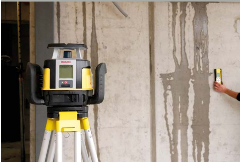
HORIZONTALER BAULASER MIT EIN-TASTEN-BETRIEB