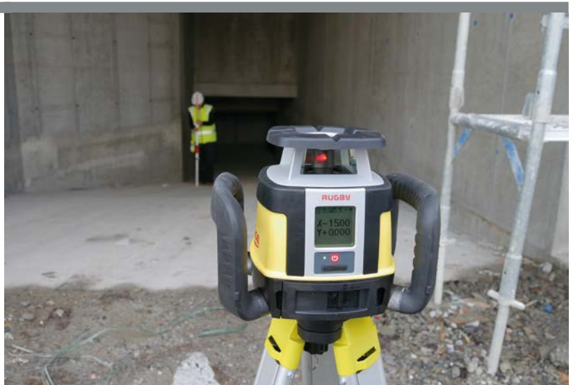
HORIZONTALER, VERTIKALER UND VOLLAUTOMATISCHER DOPPELNEIGUNGSLASER MIT DIREKTEINGABE