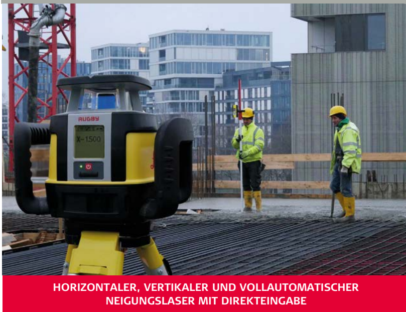
HORIZONTALER, VERTIKALER UND VOLLAUTOMATISCHER NEIGUNGSLASER MIT DIREKTEINGABE