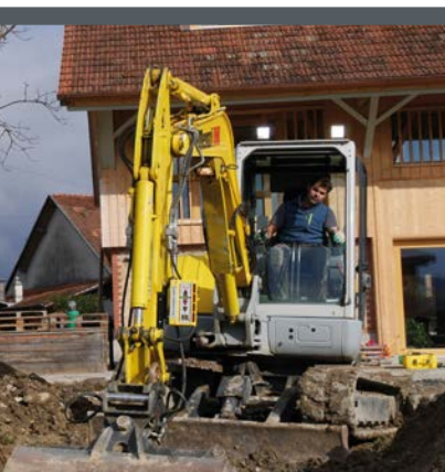
D VOLLAUTOMATISCHER DOPPEL- NEIGUNGSLASER MIT DIREKTEINGABE UND MASCHINENKOMPATIBILITÄT