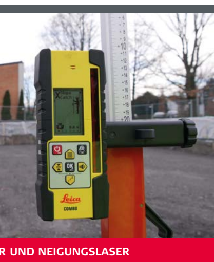
R UND NEIGUNGSLASER